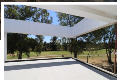
EIGENTIJDSE LUXE VILLA, 5 SLAAPKAMERS, 1E LIJNS GOLF RESORT TE KOOP PENINA, ALGARVE